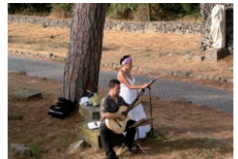
Konzert auf der Via Appia Antica

Der Ara Pacis des Augustus gab Gelegenheit zur Ruhe. Die Fülle an Statuen und Mosaiken im Römischen Nationalmuseum dagegen konnte nur gezielt besichtigt werden.