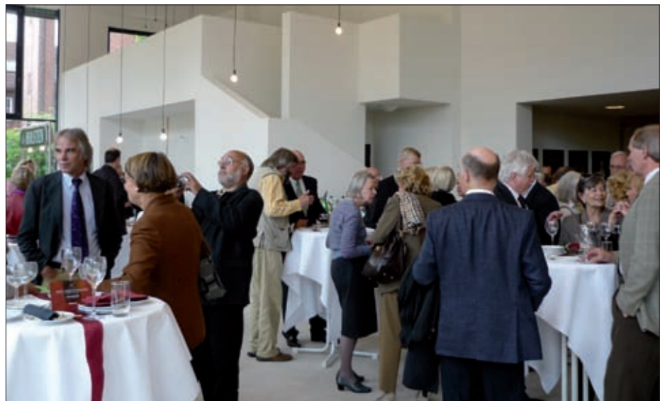
Das neue Foyer im Helms-Museum

sondern es soll als öffentlich genutzter Raum auch ein neuer Treffpunkt für Harburg sein. Das Gastronomie-Team der „Helms Lounge“ begeisterte die Besucher zum Eröffnungstag mit einem hervorragenden Catering und Service. Im stilvollen Ambiente des neuen Cafés können die Besucher auch zukünftig ihren Museums- oder Theaterbesuch bei einem Kaffee oder einem Glas Wein und einem kleinen Imbiss ausklingen lassen. Im Rahmen verschiedener baulicher Maßnahmen wurde aber in den letz-